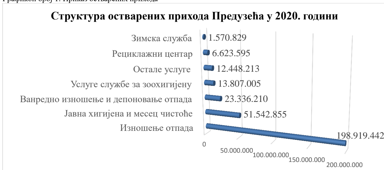
Графикон број 1: Приказ остварених прихода

Чланом 69. став 1. тачка 3) Закона о јавним предузећима, прописано је да, ради обезбеђивања заштите општег интереса у јавном предузећу, Влада, односно надлежни орган јединице аутономне покрајине или јединице локалне самоуправе даје сагласност на тарифу (одлуку о ценама, тарифни систем и др.), осим ако другим законом није предвиђено да ту сагласност даје други државни орган.